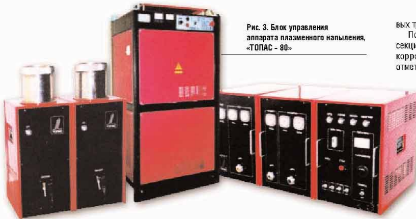
Рис. 3. Блок управления аппарата плазменного напыления «ТОПАС - 80»