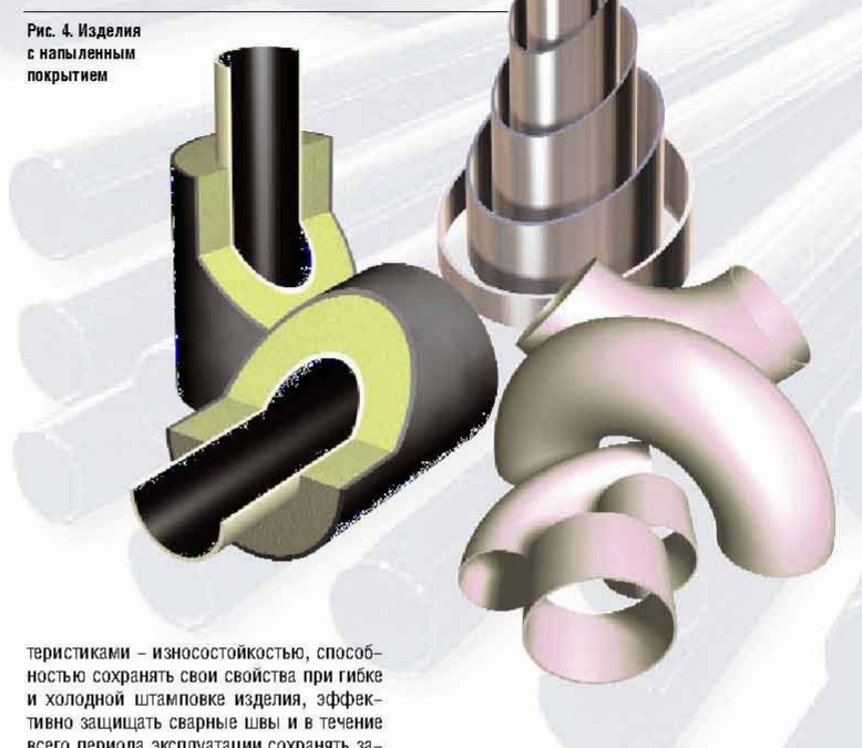
Рис. 4. Изделия с напыленным покрытием

теристиками – износостойкостью, способностью сохранять свои свойства при гибке и холодной штамповке изделия, эффективно защищать сварные швы и в течение всего периода эксплуатации сохранять защитные и декоративные свойства. Покрытие композиционное, хорошо сцеплено с основой. Состоит из алюминиевой матрицы с равномерно распределенными в ней металлургически связанными частицами керамики и интерметаллидов.